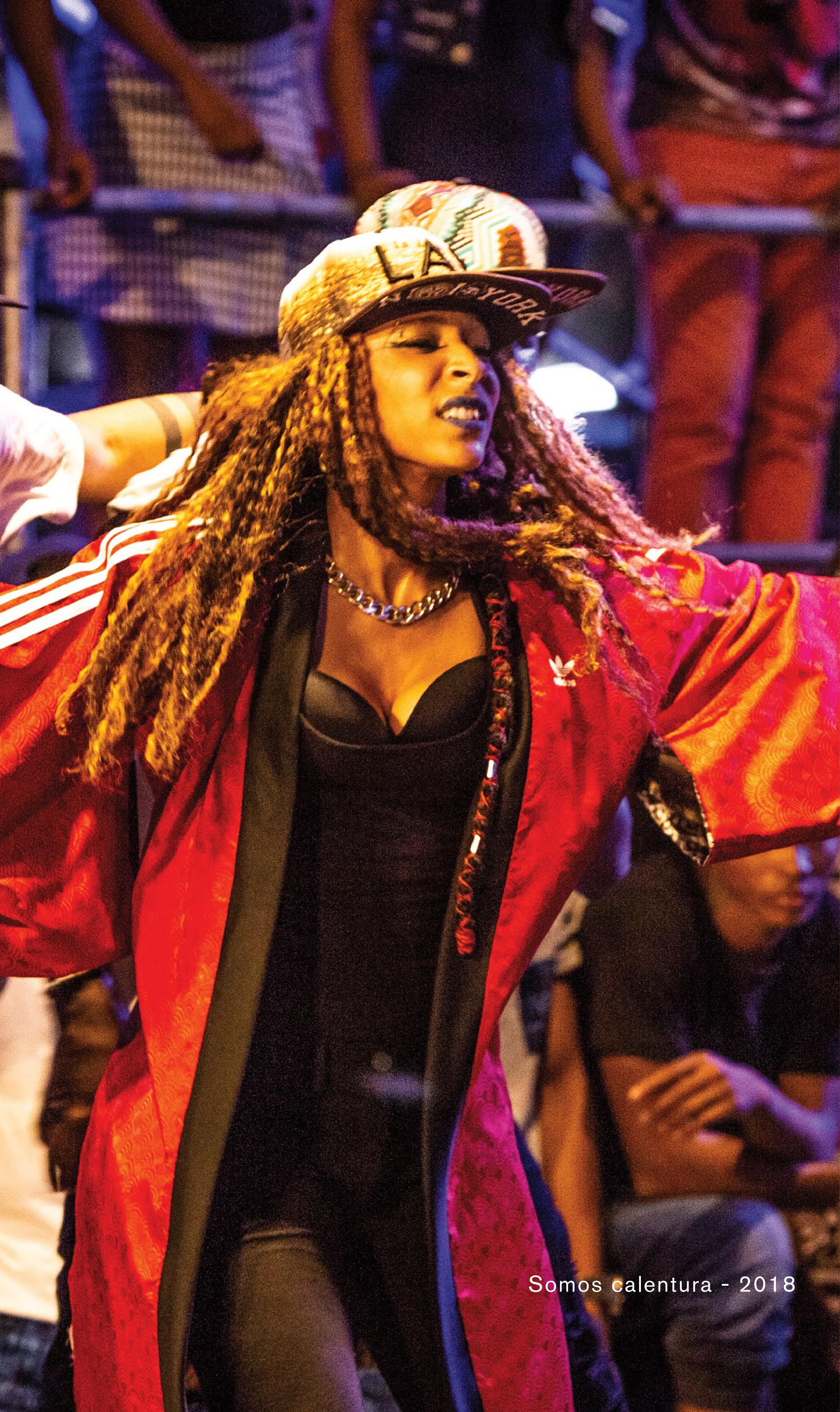
Somos calentura - 2018