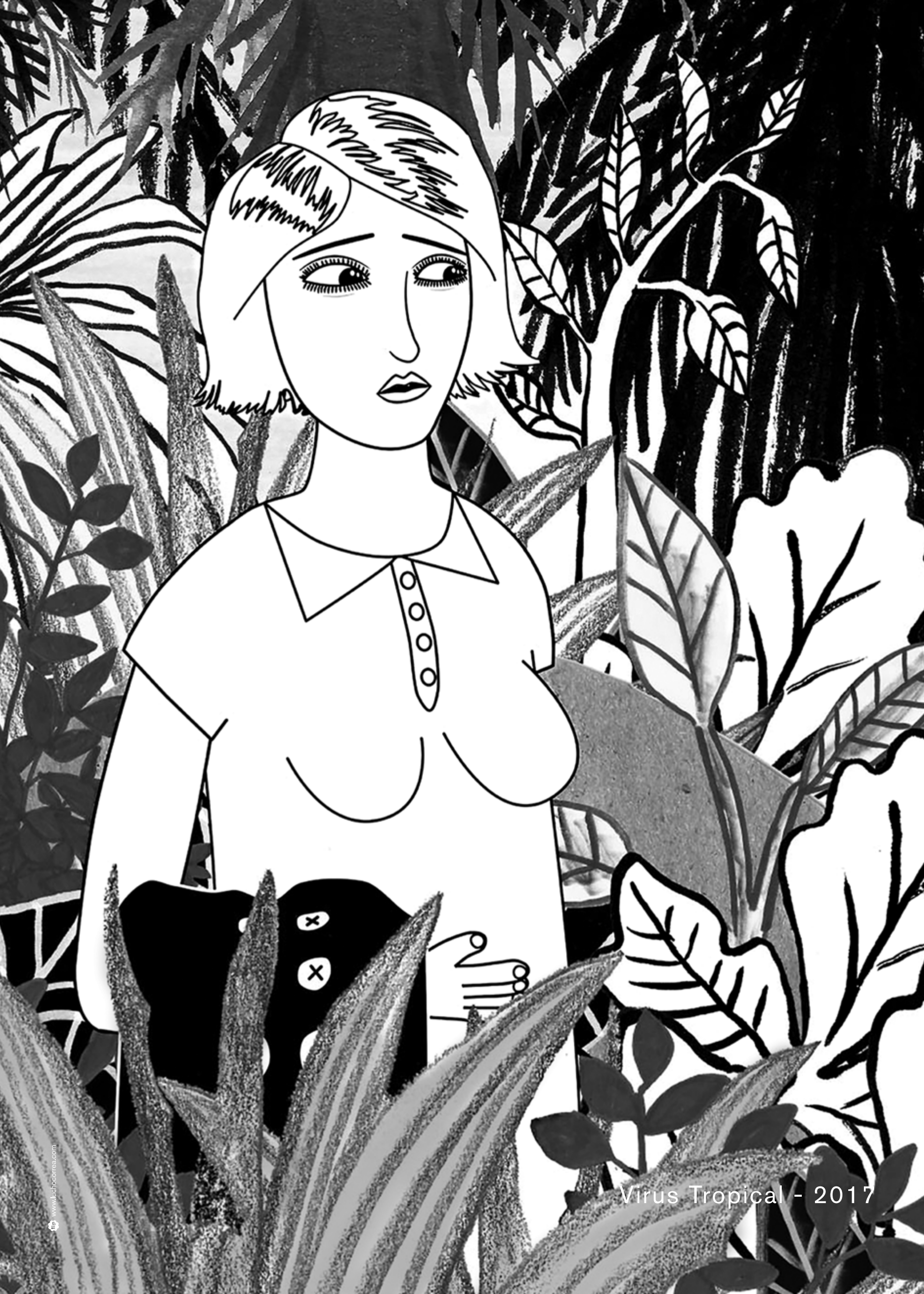
Virus Tropical - 2017