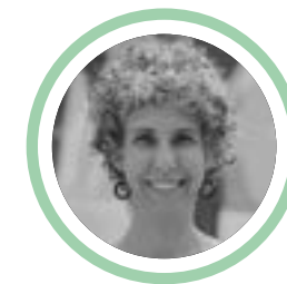
Manoela Moraes Zigiatti Brasil

Sus películas han sido premiadas en festivales como: Berlín, Chicago, San Sebastián y La Habana, exhibiéndose en más de cincuenta muestras internacionales. Formó parte del Programa de Artistas en Berlín del DAAD por el premio a su película The ilusión en la Berlinale. Ha sido profesora en la EICTV y otras instituciones en España, Portugal y Latinoamérica. Creó el programa académico de la Maestría en Cine-ensayo en la EICTV. Asesora de dirección, guion y edición de películas premiadas en Locarno, Visions du Réel, Punto de vista, FIDMarseille, DOK Leipzig y DocLisboa.